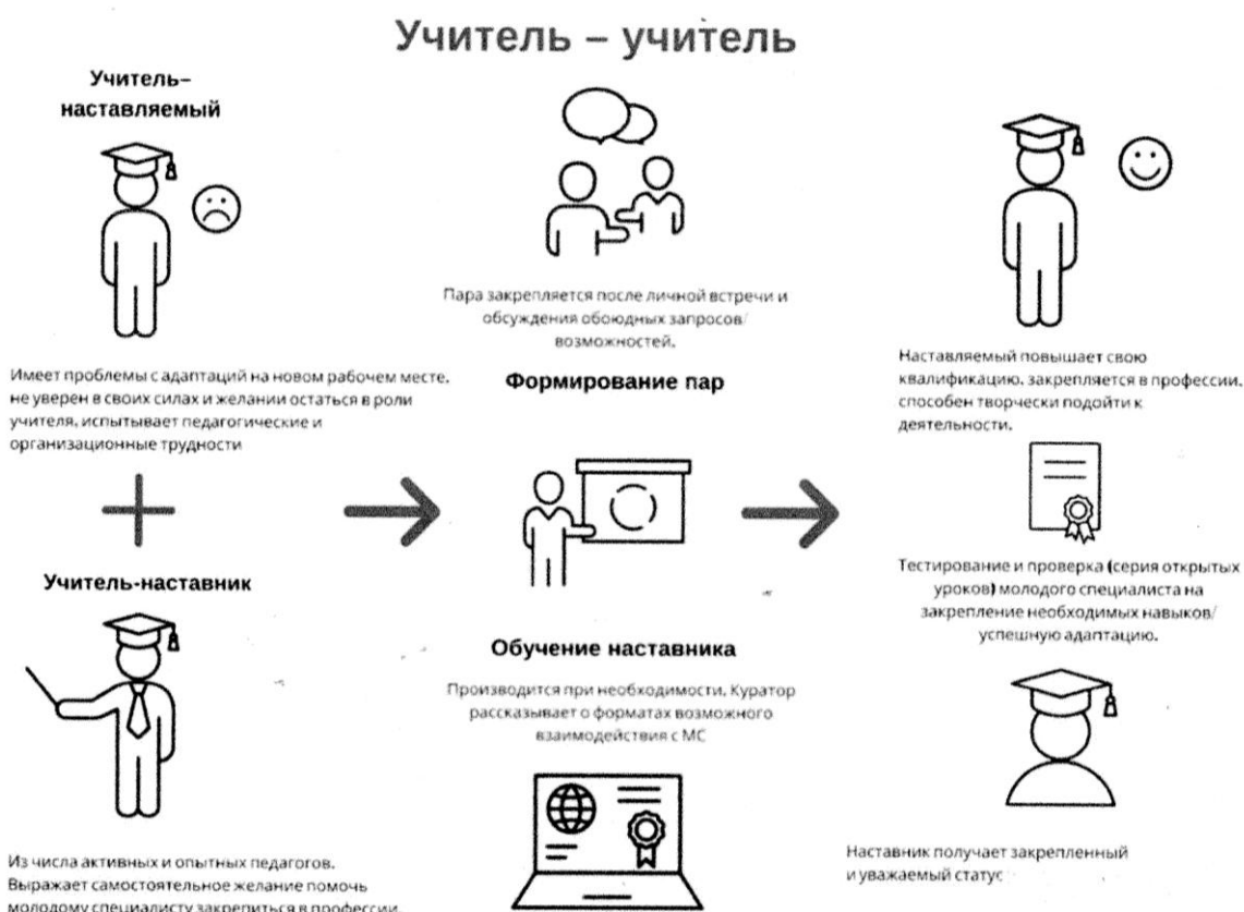
Рис.1 Форма наставничества «учитель – учитель»